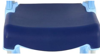
ASIENTO CERRADO Peso 940 gr. Medidas aprox. 50x52x12cm.