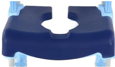
ASIENTO ABIERTO Peso 900 gr. Medidas aprox. 50x52x12cm.

Asiento de poliuretano de dos componentes (poliol e isocianato), sin CFCs ni HCFCs. Recubierto con pintura en color azul. Se ajusta al asiento fijo de la silla. Disponible en dos diseños